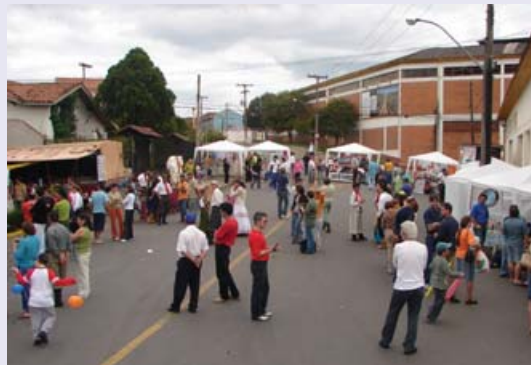
Apresentações de música e dança valorizaram a cultura gaúcha na mateada promovida pelo Stimmme e Abastecedora Décio