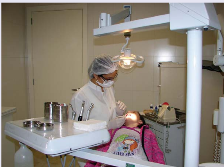
Bom atendimento, qualificação dos profissionais e estrutura do consultório estão entre os pontos positivos destacados por quem já aproveitou a facilidade