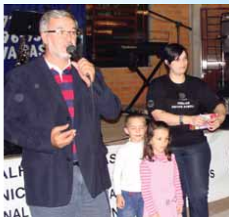
O sorteio de brindes foi um dos pontos altos do encontro