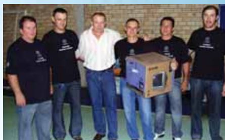
Os organizadores acompanharam o sorteio de brindes