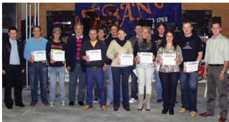
Formandos do curso de leitura e interpretação de desenho receberam o diploma durante o evento