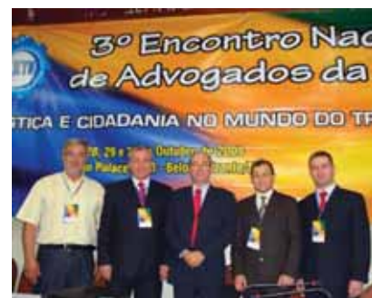
Stimme marcou presença no evento em Belo Horizonte

Representando o segmento, o Stimme mandou seus representantes à Belo Horizonte para participar do 3º Encontro Nacional de Advogados da Confederação Nacional dos Trabalhadores Metalúrgicos. A oportunidade busca aprimorar a assessoria jurídica de suas entidades filiadas, abordando temas atuais e de extrema importância para a categoria, bem como para a sociedade em geral. O encontro aconteceu nos dias 28, 29 e 30 de outubro.