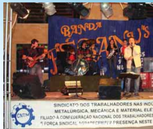
O show contagiou os presentes e garantiu a animação