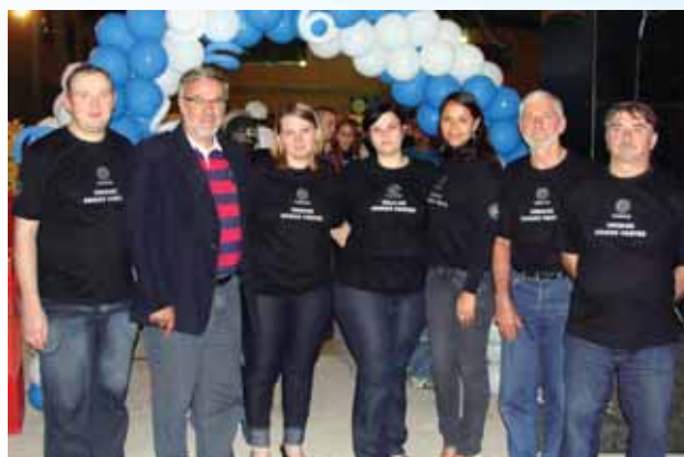
Comissão organizadora comemora o sucesso da festa