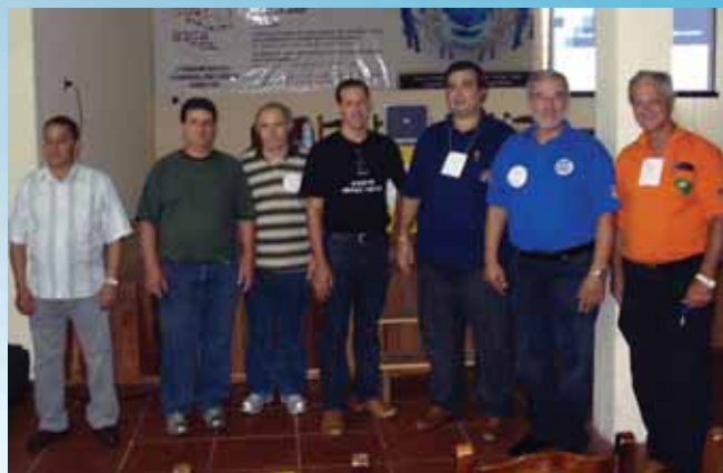
Comitiva do Stimmme represento trabalhadores no encontro

Num cenário em que a tecnologia tem cada vez mais evidência no mercado profissional e os cuidados com a saúde do trabalhador merecem atenção crescente, ajustar-se às mudanças é necessário para quem busca estabilidade e qualidade de vida. Buscando caminhos para atender as reivindicações da categoria que representa, o Sindicato dos Trabalhadores nas Indústrias Metalúrgicas, Mecânicas e de Material Elétrico de Bento Gonçalves participou das atividades do Fórum Social Mundial da Serra Gaúcha, nos dias 23 e 24 de janeiro.