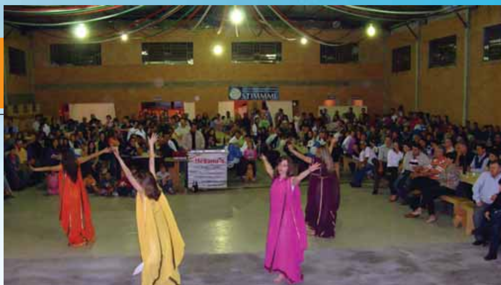
Mais de 400 pessoas prestigiaram a programação que inclui apresentações artísticas

A agenda de confraternizações seguiu ao longo do mês em Guaporé, no dia 21, e Nova Bassano, no dia 28. Com o formato de jantar-dançante, os encontros serviram para promover a união entre os trabalhadores das indústrias metalúrgicas, mecânicas e de material elétrico. Em todos os encontros, sorteio de prêmios entre os associados e animação musical com show de bandas fizeram sucesso entre os presentes.