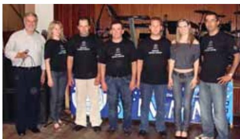
Responsáveis pela organização ao lado do presidente do Stimme