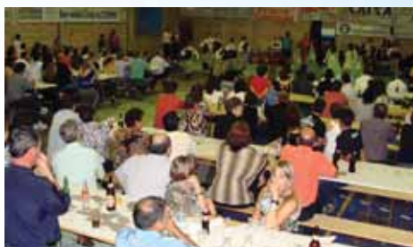
Evento serviu de oportunidade para integrar os associados