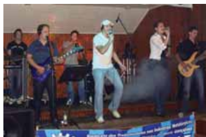
Animação garantida com a atração musical