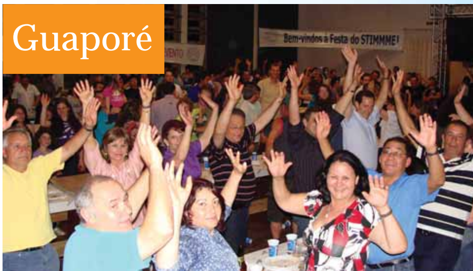
Associados compareceram em grande número para prestigiar a programação festiva