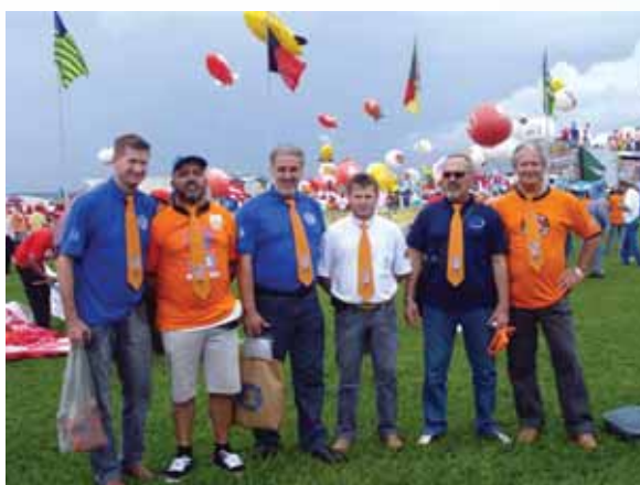
Principal reivindicação foi a redução da jornada de trabalho sem redução salarial

como a correção da tabela do Imposto de Renda, o aumento real para os aposentados que ganham acima do mínimo, a derrubada da emenda 3 (que dava início à retirada de direitos trabalhistas, permitindo a contratação dos trabalhadores como pessoa jurídica), a legalização das centrais sindicais e a política de valorização do salário mínimo que irá vigorar até 2023.