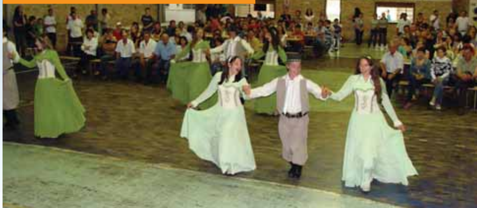
Confraternização contou também com a apresentação de danças típicas